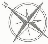
Схема планировочной организации земельного участка. М 1:500.