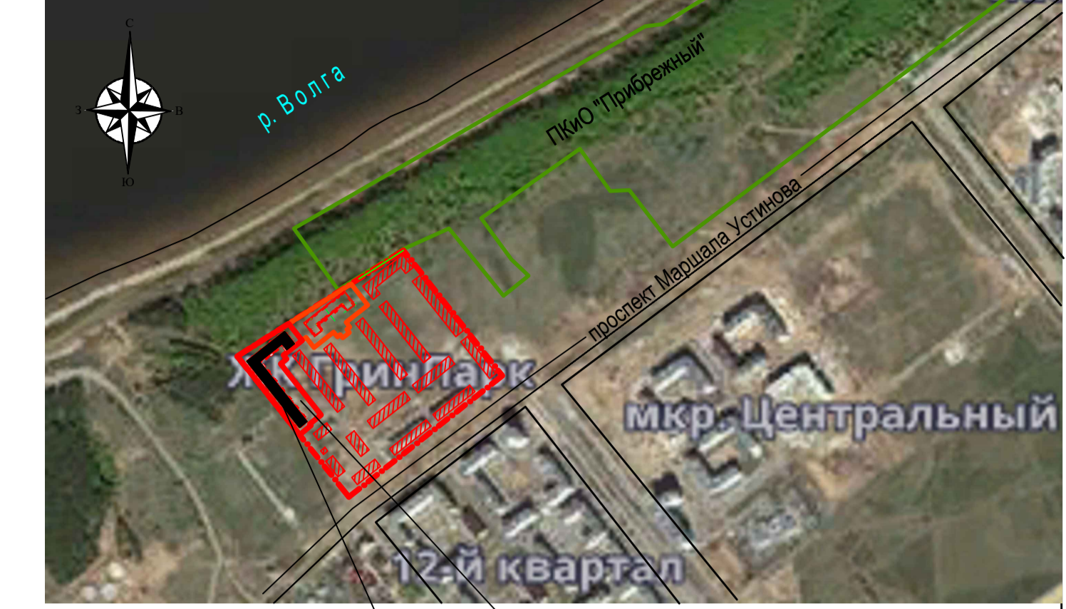
Проектируемый жилой дом №9 Проектируемый земельный участок с кадастровым номером 73:24:021015:3567