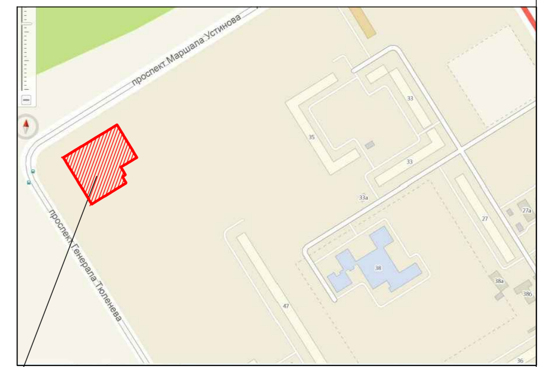
Участок отведенный под строительство