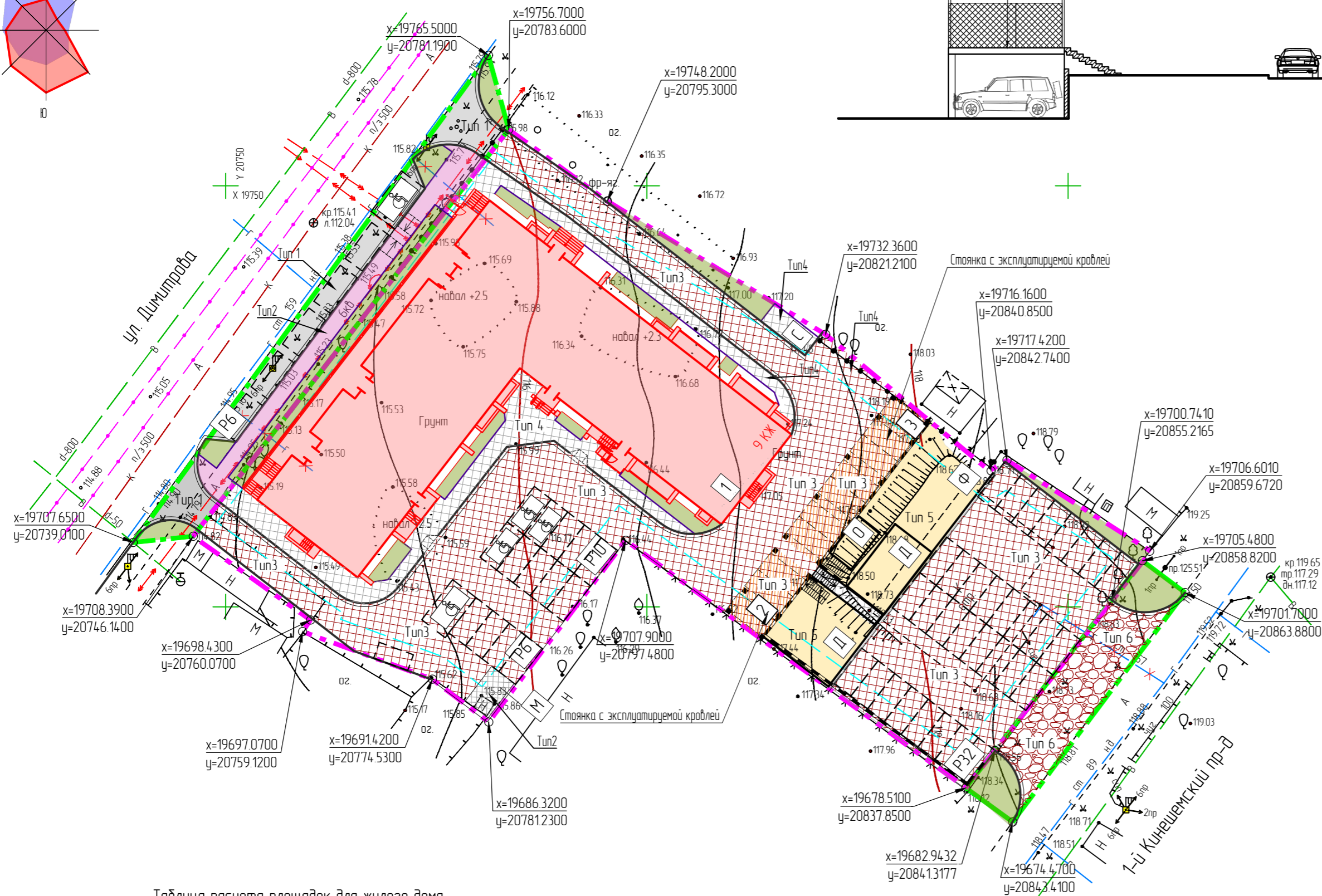
Таблица расчета площадок для жилого дома