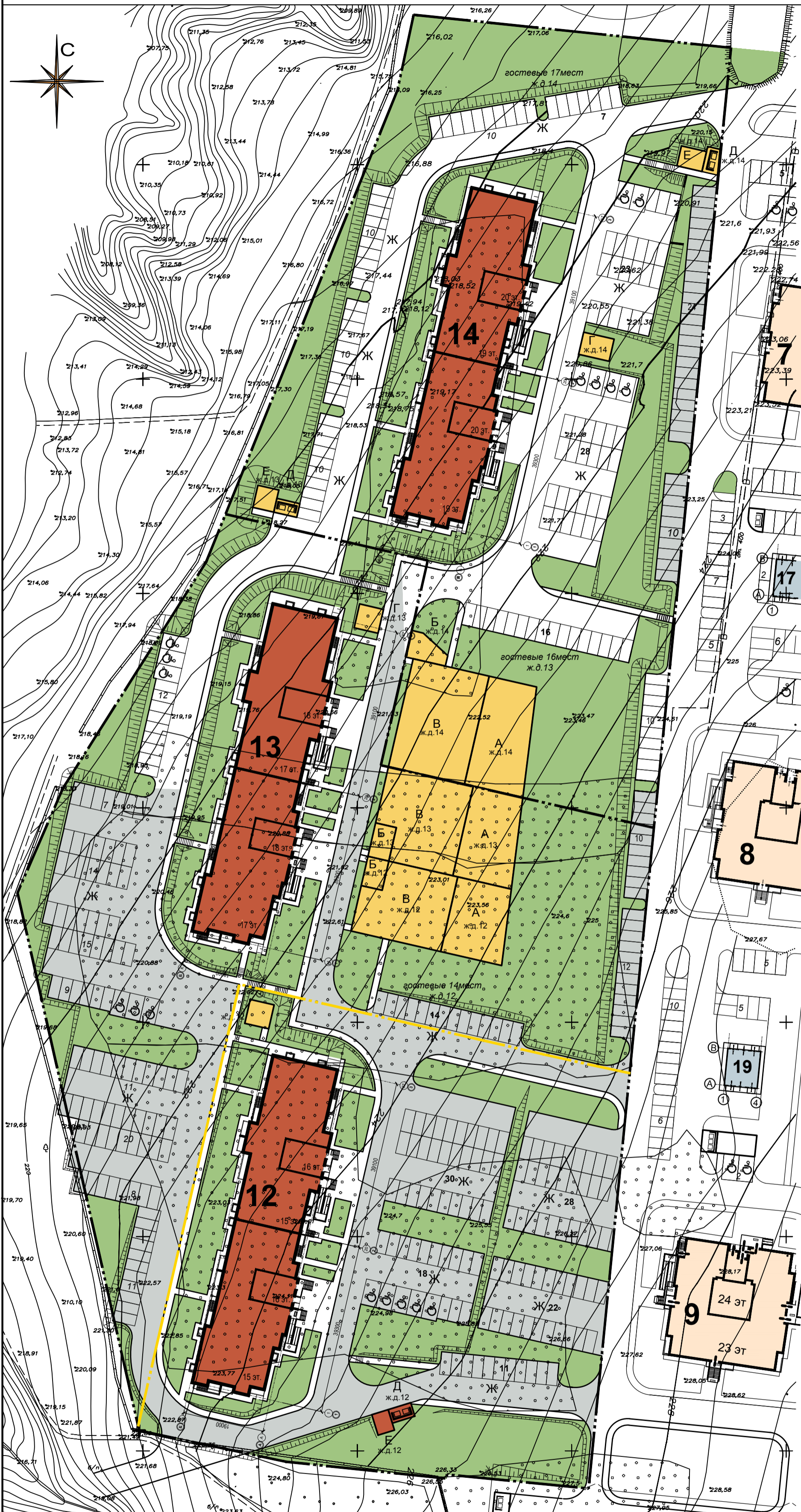
Схема планировочной организации земельного участка М 1:500