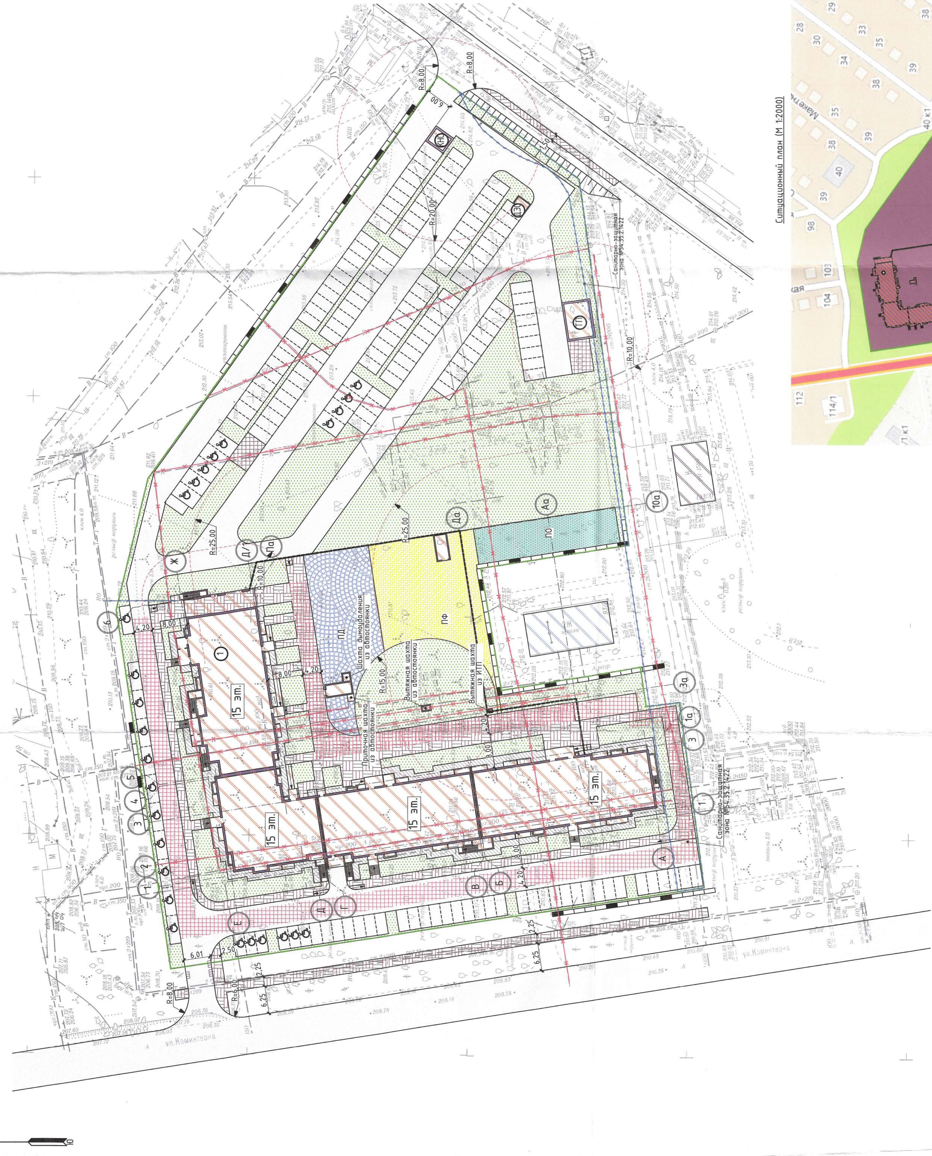
Ситуационный план (М 1:2000)