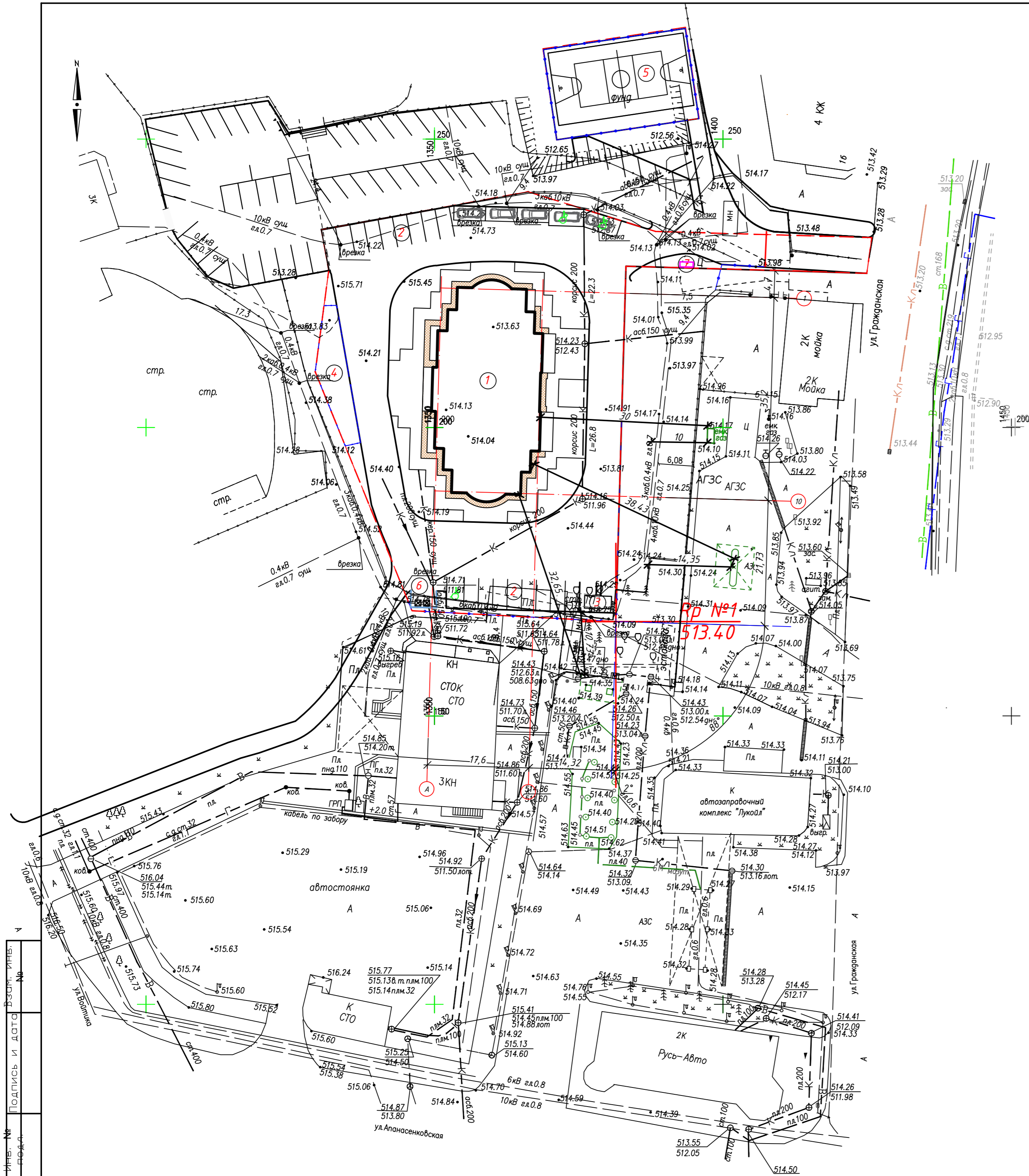
Ведомость жилых и общественных зданий и сооружений