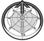
СХЕМА ПЛАНИРОВОЧНОЙ ОРГАНИЗАЦИИ ЗЕМЕЛЬНОГО УЧАСТКА, М 1:500