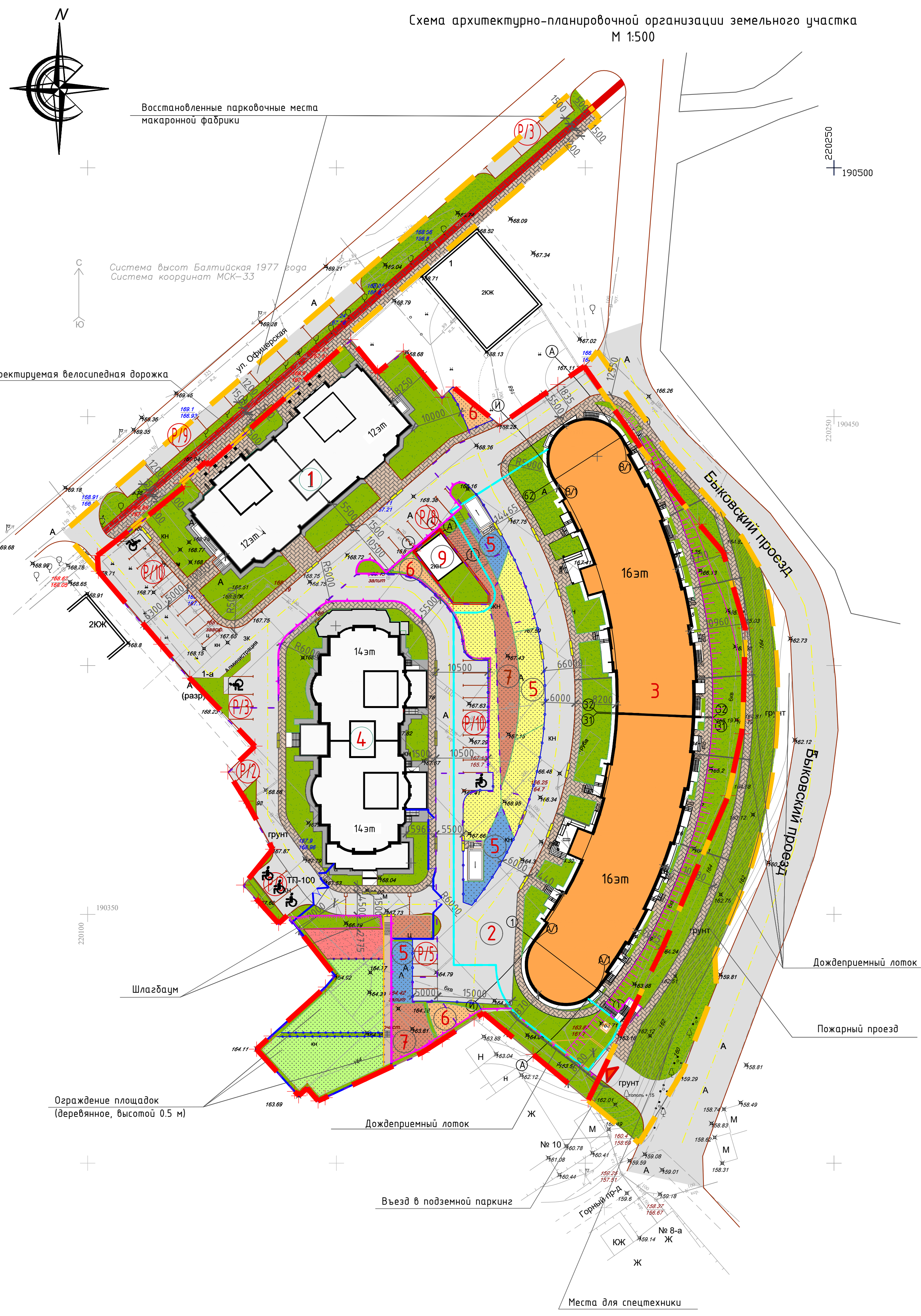
Схема архитектурно-планировочной организации земельного участка М 1:500