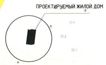
Ведомость координат участка