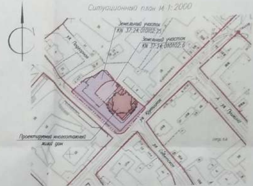
Экспликация зданий и сооружений