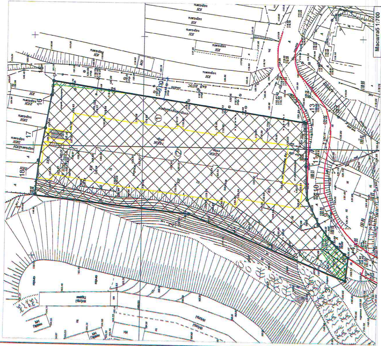
1. Чертеж градостроительного плана земельного участка и линий градостроительного регулирования