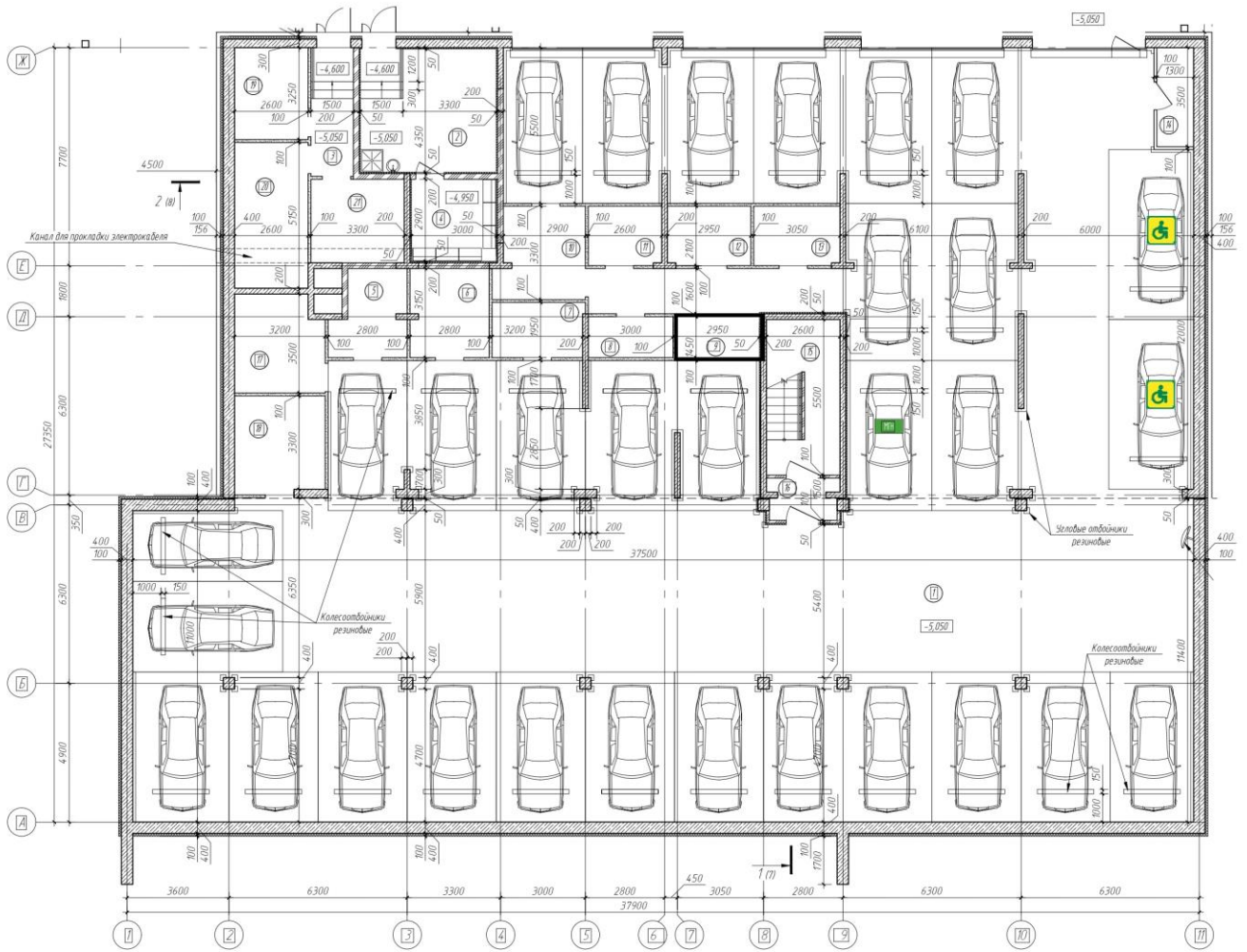
Ситуационный план помещения: