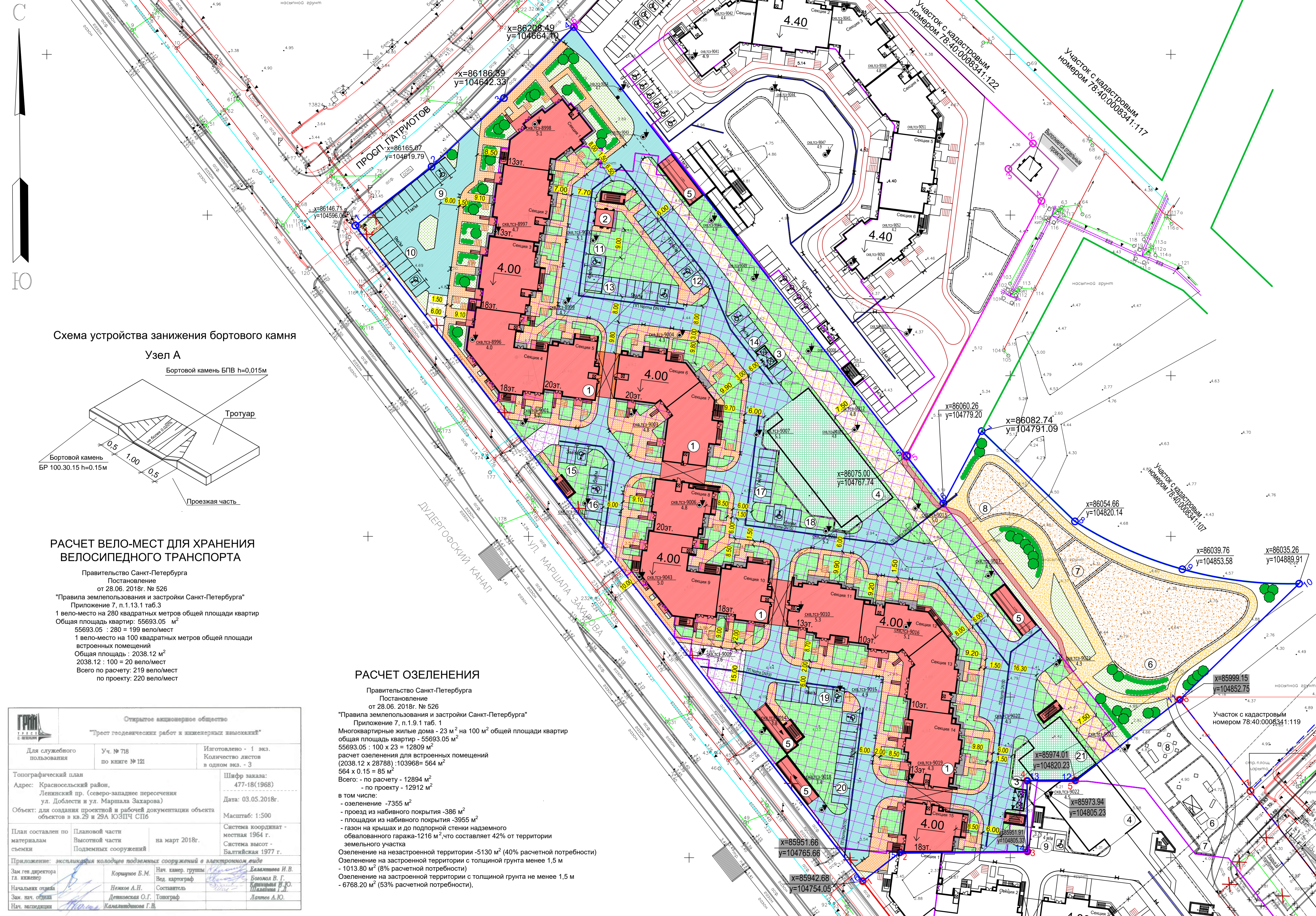
Схема устройства занижения бортового камня