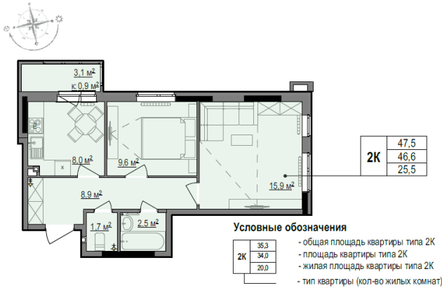
Комплекс многоквартирных жилых домов по ул. Районная в Индустриальном районе г. Ижевск. Жилой дом №1 из 2-х строений с надземной закрытой автостоянкой автомобилей

*Обозначения в планировке являются условными (схематичными) и не выражают конечные потребительские предпочтения в планировке и назначении помещений.