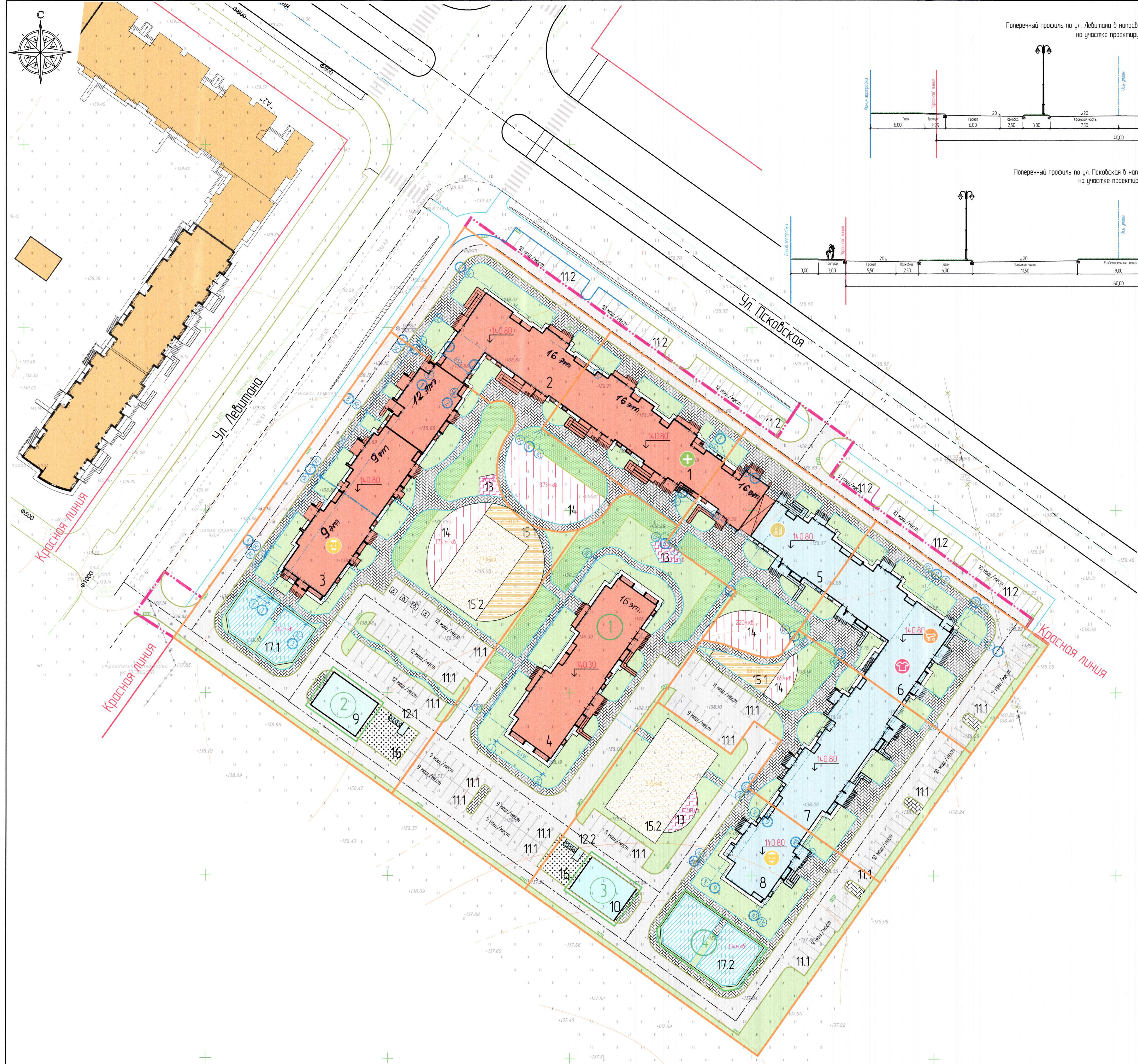
Поперечный профиль по ул. Левитана в направлении от ул. Псковская к а/д М 10 "Россия" на участке проектируемой застройки