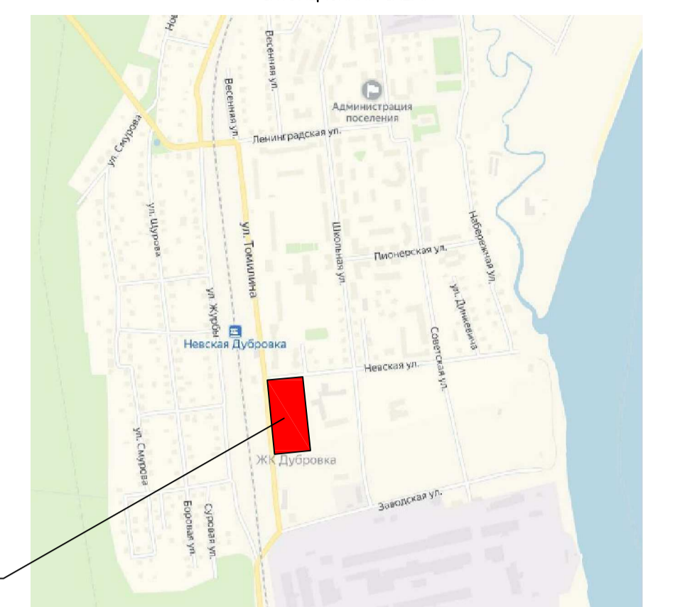
Местоположение проектируемого объекта