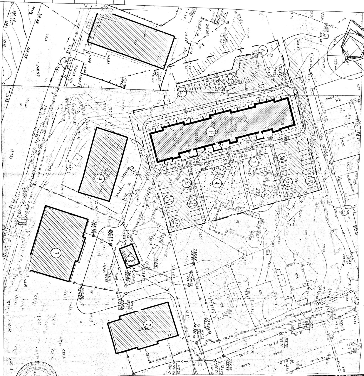
СХЕМА ПЛАНИРОВОЧНОЙ ОРГАНИЗАЦИИ ЗЕМЕЛЬНОГО УЧАСТКА. М:1.500.