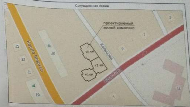
Экспликация зданий и сооружений

Данная схема планировочной организации земельного участка разработана на основании градостроительного плана земельных участков, выполненный управлением по строительству архитектуры и градостроительству от 07.11.2014, и проекта межевания территории в границах улиц Никитина, Кольцова, Аристовая, К.Маркса, в Трусовском районе, предоставленный фирмой ООО "Лютан - Строй", выполненный организацией "Астрахань гидрозем" - май 2014г. Система высот Балтийская, система координат условная, отметки абсолютные, отрицательные.